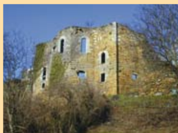
Chapelle dite des Templiers