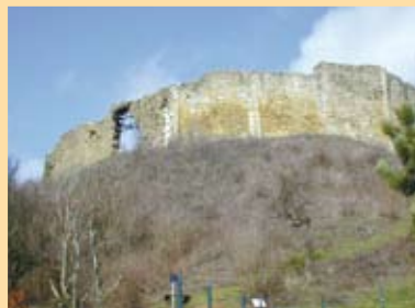
Mur de la lère enceinte

13 Cheminée de la maison Seigneuriale : à ce niveau la muraille a une largeur de 2,50m et une hauteur de 9m. On remarque le conduit de cheminée de la demeure seigneuriale.