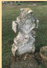
tombe de l'abbé Sacré