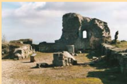
Ruine de la chapelle castrale

14 Chapelle castrale : chapelle construite par la comtesse Sophie au XIème siècle. Détruite lors de la seconde guerre mondiale. Elle a fait l'objet de recherches lors d'une campagne de fouille en 1987. La chapelle était surmontée d'une statue de Jeanne D'Arc que l'on peut encore voir sur le site dans l'ancien cimetière communal.