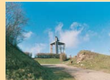
Chapelle de Lumière - tour des loups

10 Chapelle de Lumière : édifice construit après la seconde guerre mondiale. La structure de verre et de métal abrite un Christ en croix que l'on doit au sculpteur Bernard Mougin, fils du céramiste nancéien appartenant à l'Ecole de Nancy.