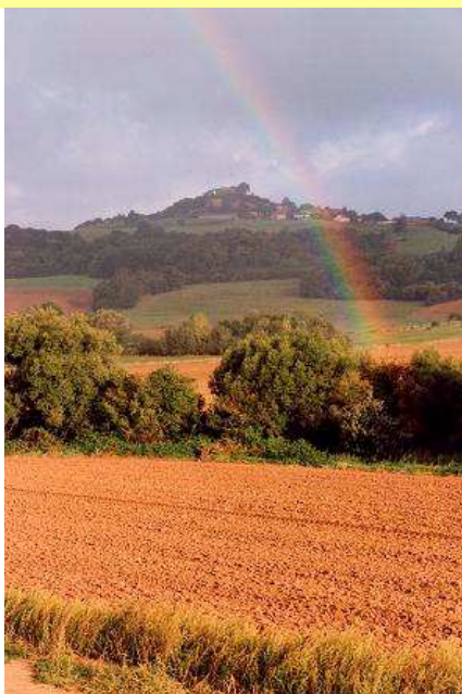
Photo « Mousson en été » d'Hervé RAGOT d'Atton, généreusement offerte par son concepteur pour illustrer les enveloppes vendues par La Poste. Elle fait partie d'une série de 4 (une par saison)

Sur le site de Mousson : la teneur est faible avec 0.8 \mu\text{g}/\text{m}^3 (Maidières et centre ville de PAM avec 1.4 et 1.6 \mu\text{g}/\text{m}^3 ).